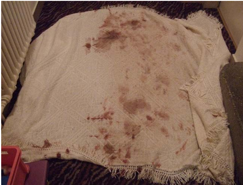
Eines der Tücher, die wir immer wieder wechseln mussten

Sie wurde immer schwächer, konnte kaum noch die 6 Treppenstufen zur Wohnung hinauf gehen. Wir beschränkten den Auslauf nur noch ums Haus herum. Ich habe mich schon langsam mit dem Gedanken abgefunden, dass Sheyna an Weihnachten wohl nicht mehr bei uns ist, denn vor einem Jahr habe ich genau so ihre Halbschwester hergeben müssen.