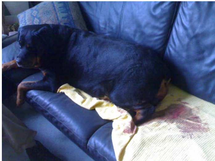
Dasselbe Erscheinungsbild bei Xena: starker blutig-eitriger Ausfluss

Ich denke - rein biologisch gesehen - konnte Xena gar nicht definitiv ihre Heilphase durchmachen, weil sie dauernd auf der Schiene war und weil wir es einfach zu spät entdeckt haben, dass sie eine Gebärmuttergeschichte am Laufen hatte.