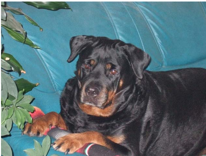
Xena in noch gesunden Tagen

Ich möchte einen Vergleich aufzeigen zu Sheynas Halbschwester Xena, die im September 07 gestorben ist. Sie hatte dieselbe körperliche Geschichte wie Sheyna.